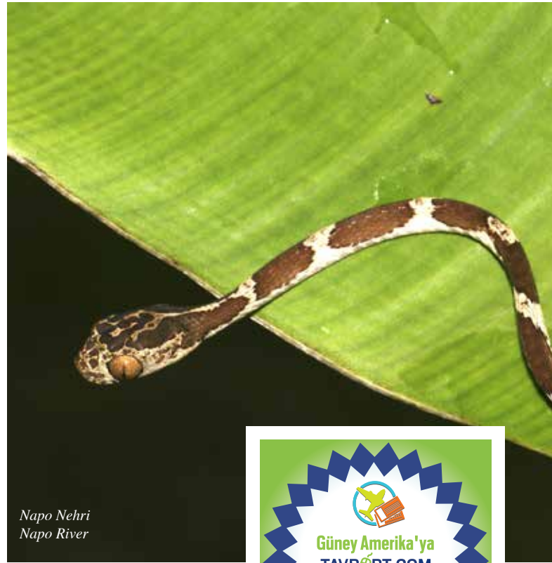
Napo Nehri Napo River

Unlike many countries, Ecuador offers many different tourism alternatives, including ecological, cultural and health tourism, as well as community tourism where you can see local tribes and adventure tourism where you can explore volcanoes.