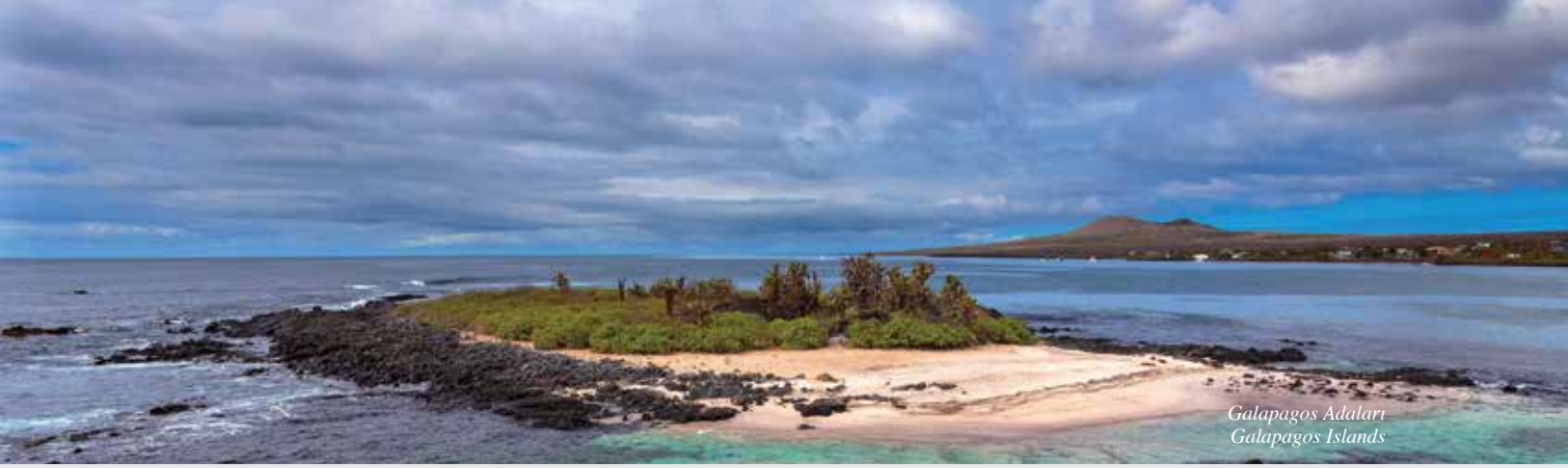
Galapagos Adaları Galapagos Islands