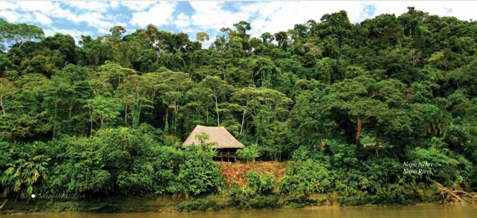
Napo Nehri Napo River

One of the main problems for Turkish tourists when traveling is the visa requirement. Sometimes, even putting together the documents required and the difficulty of the process on its own can be discouraging for many people. That is why the destinations requiring no visa are the most popular among Turkish tourists. As a result, places like Dubrovnik, Beirut and the Greek Islands cruise tours have become very popular in Turkey. Ecuador is not as close as these destinations, however, the fact that there is no visa requirement for Turks may be appealing.