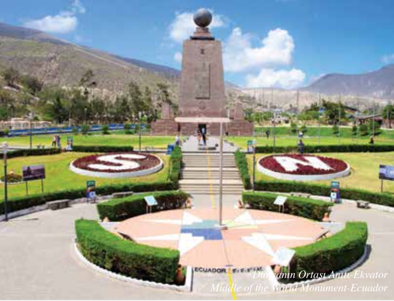
Dünyanın Ortası Anıtı-Ekvator Middle of the World Monument-Ecuador