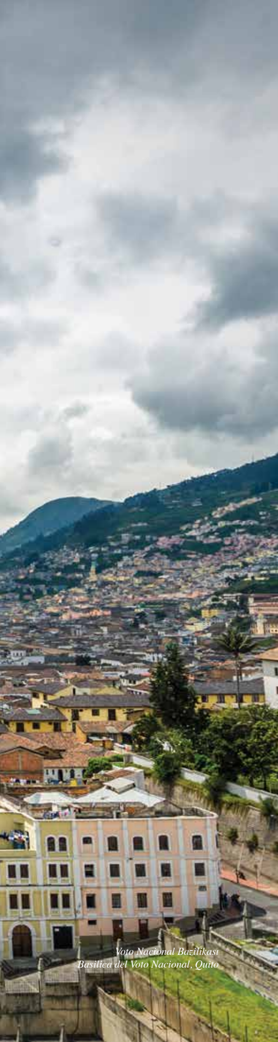
Voto Nacional Bazilikası Basilica del Voto Nacional, Quito

I lk başlarda seyahat etmek çok kolaydır. Tabii ekonomik imkânınız varsa. Önce bir Paris yaparsınız. Sonra Roma, New York, Londra, Prag diye uzar liste. Ancak tüm turizm kışkıklarını bitirdikten sonra giderek daha otantik destinasyonlara doğru bir istek başlar içinizde. Türkiye’de de turizm büyüdükçe benzer bir talep oluşuyor. Türkiye Seyahat Acenteleri Birliği (TURSAB) Yönetim Kurulu üyesi Sinan Haliç, “Türkiye’de turizm hızla büyüyor. Turistik talebin yüzde 26’sı otantik taleplere doğru kayıyor” diyor. Bu anlamda Güney Amerika’nın ufak ülkesi Ekvator ilginç bir alternatif olabilir.