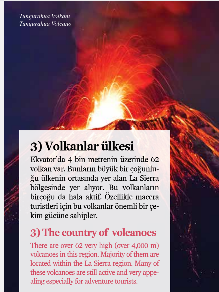
Tungurahua Volkanı Tungurahua Volcano

You find yourself in a very different geography in Ecuador within just 25 minutes. It is very easy to travel from the 300 m high coastal area to 3,000 m highlands. Similarly, you can be in the Amazon Rainforests within just half an hour. The country contains more than 600 different species of birds. There is tremendous diversity, both geographically and in terms of plant and animal species.