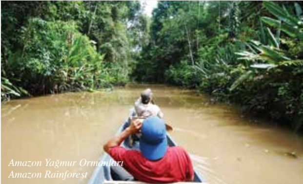
Amazon Yağmur Ormanları Amazon Rainforest

The Galapagos Islands, which are comprised of 14 large and 8 small islands and 40 islets, were discovered by the Bishop of Panama Tomas de Berlanga on his way to Peru in 1535. 97 per cent of these islands, which are listed on UNESCO's World Heritage List, were declared national parks. The total population of these islands is 25,000. Charles Darwin wrote the theory of evolution following his research on these islands. The giant turtles which live on the island along with many other species attract huge interest from tourists. The islands also host many active volcanoes. You can go to these islands by air or boat. There are also cruises operating between the islands. However, boats with less than 100 people are allowed to enter the islands.